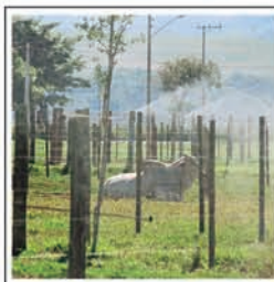
PIQUETES FUNCIONAIS, cobertos, com sistema de irrigação e drenagem e acesso com ruas totalmente asfaltadas.