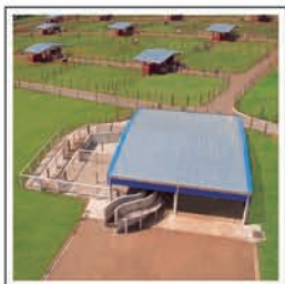
QUARENTENA com curral antiestresse.